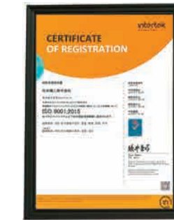
品質マネジメントシステム ISO9001:2015