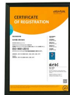
品質マネジメントシステム ISO9001:2015